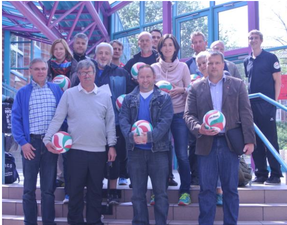
Viele Vertreter der Vereine und Partnerschulen haben am Erfahrungsaustausch teilgenommen.