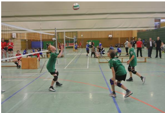
Den Punkt zum Sieg machten die Jungs aus Sundern in einem knappen Finalspiel gegen die Mädchen des Rhein-Maas-Gymnasium Aachen.